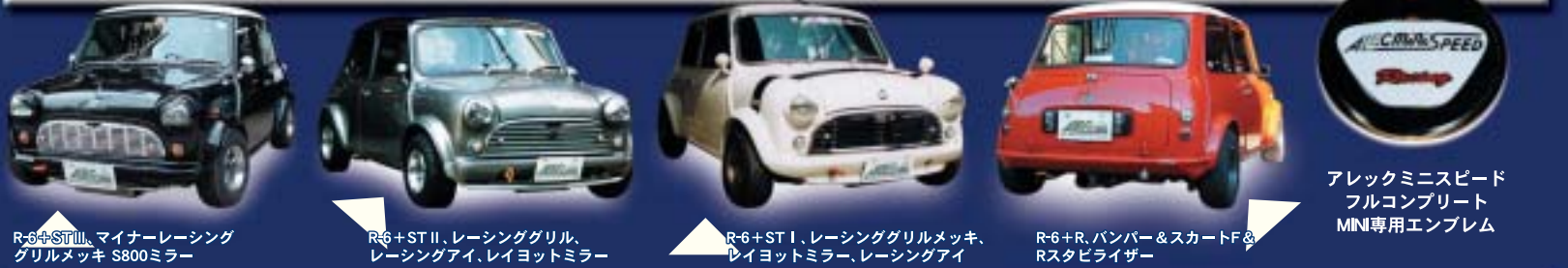
R-6+ST III, マイナーレーシング グリルメッキ S800ミラー