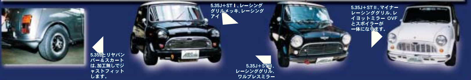
5.35Jとリヤバン パー&スカート は、加工無しで ジャストフィット します。