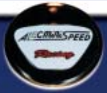
アレックミニスピード フルコンプリート MINI専用エンブレム