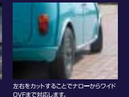
リアバンパー&スカート 5.35JにJUST FIT! 左右をカットすることでナローからワイドOVFまで対応します。