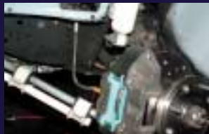
4ポットキャリバー VALTAIN-NARITA Project ムバッド、ステンホース。よく止まる=安全です。