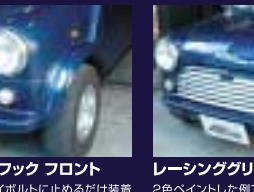
レーシングフック フロント ノーマルのアイボルトに止めるだけ装着可能です。