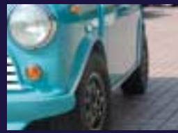
ナローアーチ4.5J 合法! ナローStance、純正アルミ&4.5J-10インチ対応です。