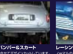
リアバンパー&スカート R-6に合せてデザインカットしています。5.35Jには、無加工で装着できます。