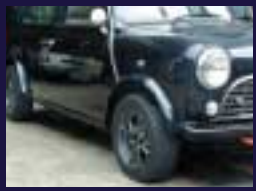
5.35J セミレーシング・モールレスOVF&VALTAIN 5J-12+R7 ST-III, Aタイプミラーステイ、レーシンググリル、レーシングフック