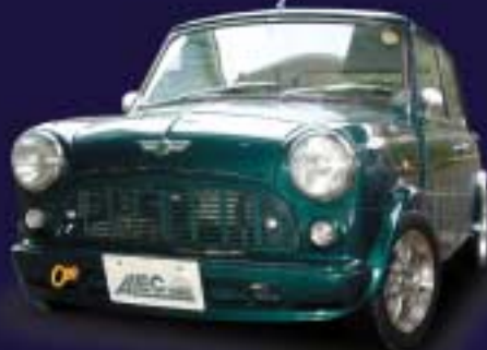
5.35JモールレスOVFベースのセミレーシングStance