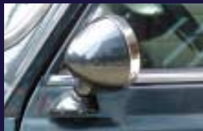
レイヨット専用ドアミラーステイ フェンダーミラーを手軽にドアミラーに。他にも色々なミラー専用ステイがあります。