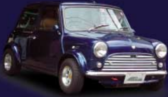
R-6 レーシングOVFを基本とするワイドボディ・レーシングStance

コンセプト別に代表的なバージョンをご紹介します。今年のパーツカタログをご覧になって、こんなパーツを付けたらどうなるのかな? と思った貴方の為だけに、自信をもって贈るアレック・ミニスピード・ワールドです。これで半年は楽しめます。