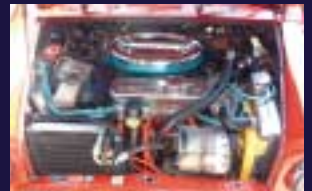
エンジンルームにもクオリティアップとメンテナンスを アーシングは基本です。エアリボックスCAPメック、アルミラジエーター、アロイCAPカバー