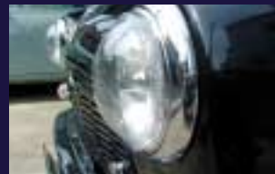
ヘッドライトカバー (ポリカーボネイト製) ライトを保護し丸みを強調します。

続いて、100アイテム以上がリリースされているアレック・オリジナルパーツを装着したらこんなミニに変身する実例をご覧ください。貴方のお探しのパーツがきっとあるはずですよ。