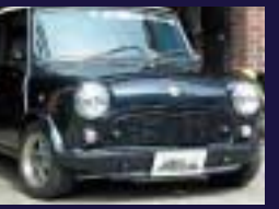
フロントスポイラーST-I バンパー付にも対応します。5.35J+ST4&マイナーレーシンググリル、VALTAIN 12インチアルミ