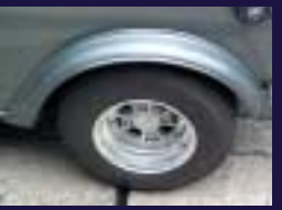
R-6 OVFの左リアのアップです。 車高が低く見えます。VALTAIN 3ピース+032R、ヨタレカ、レーシングGAS CAP