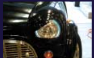
レーシングアイ 中にはヘッドライトカバーが、その中にはエンジェルアイ