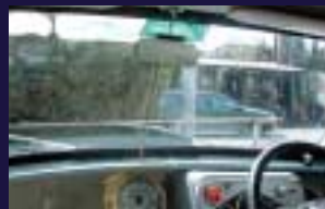
センタービジュアルルームミラーAssey ミラーの位置を自由に上下できます。ウィンテージにもミラー専用ステイがあります。