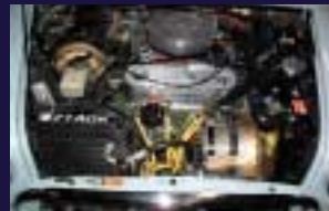
エンジンルームにもクオリティアップとメンテナンスを HKSパワーフロー、ウルトラコード、アロイCAPカバー