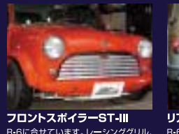
フロントスポイラーST-III R-6に合せています。レーシンググリル、ライトカバー