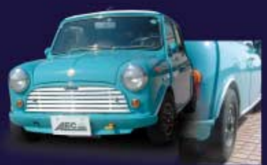
ナローアーチ4.5Jがクラシカルな雰囲気を出すナローStance

続いて、100アイテム以上がリリースされているアレック・オリジナルパーツを装着したらこんなミニに変身する実例をご覧ください。貴方のお探しのパーツがきっとあるはずですよ。