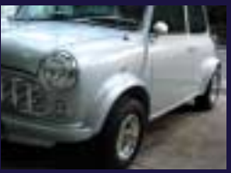
R-6レーシングOVF&VALTAIN 5J-10+032R ST-I, マイナーレーシンググリル