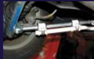
ローズジョイント&スタビライザー コーナーリングが格段に楽しくなります。