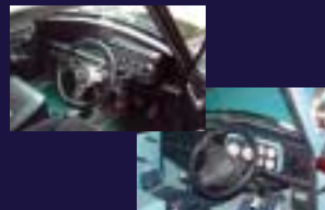
メーターカウル&メーターパネル 純正ウッドパネル対応、お客様の好みにより仕上げます。