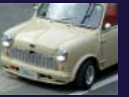
フロントスポイラーST-II こちらもバンパー付にも対応します。ST-IIは5.35J OVFと合体して一体となります。