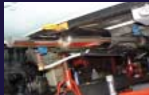
VALTAIN オールステンサイド出しマフラー 上品な音質、スタビ・レーシングフックはリア用。