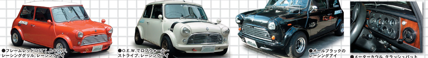
●フレームレッドBEST II, R-6 OVF, レーシンググリル, レーシングアイ ●O.E.W.でロブウカー ストライプ, レーシングアイ ●オールブラックのレーシングアイ

● RACING STANCE R-6レーシングOVFを基本とするワイドボディ派、レーシングミニを思わせるいでたちをこよなく愛する方は、実はメンテナンスを欠かさないものです。