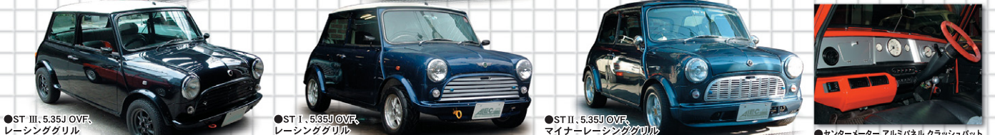
●ST III, 5.35J OVF, レーシンググリル ●ST I, 5.35J OVF, レーシンググリル ●ST II, 5.35J OVF, マイナーレーシンググリル

● SEMI RACING STANCE 5.35JモールレスOVFを基本とし、すっきりとしたモディファイを好み、走る楽しめと機能性を重視した個性派の代表的な形です。