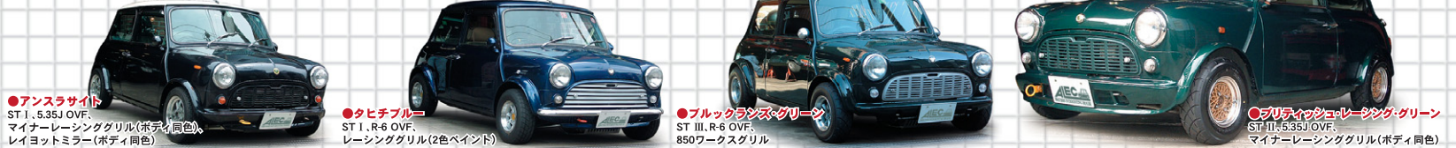
● アンストライト ST I, 5.35J OVF, マイナーレーシンググリル(ボディ同色), レイヨットミラー(ボディ同色) ● タヒチブルー ST I, R-6 OVF, レーシンググリル(2色ペイント) ● ブルックランズ・グリーン ST III, R-6 OVF, 850ワークスグリル ● ブリクハッシュ・レーシング・グリーン ST III, 5.35J OVF, マイナーレーシンググリル(ボディ同色)

●ポピュラーな純正色のALEC MINI SPEED、コンプリート・ミニをご紹介します。みんな楽しんでますよ。