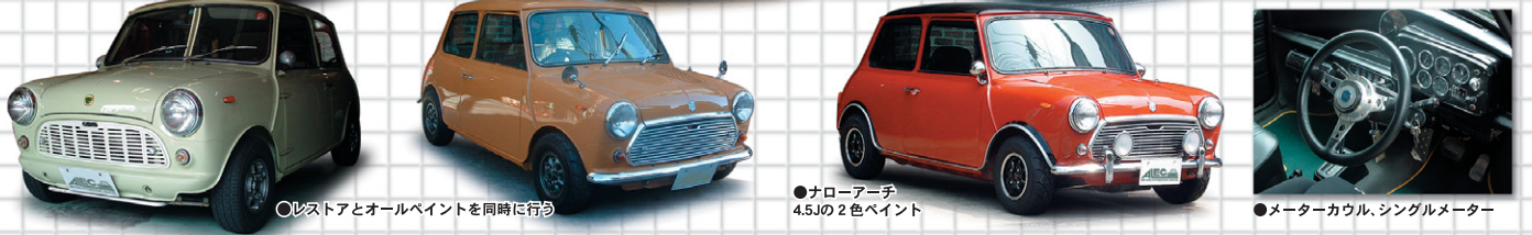
●レストアとオールペイントを同時に行う ●ナローアーチ 4.5Jの2色ペイント

● NARROW STANCE ナローアーチやフェンダーレスで見た目はシンプルですが、見えない所すべてにクオリティアップを施し、一見おとなしいが、走りを見たらぶったまげる、そんな楽しみ方もミニの魅力です。