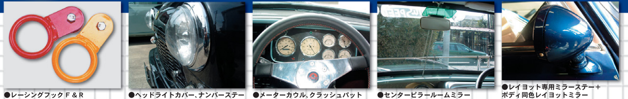
●レーシングフック F & R ●ヘッドライトカバー、ナンバーステー ●メーターカウル、クラッシュパット ●センターピラー・ルームミラー ●レイヨット専用ミラーステー+ボディ同色レイヨットミラー

ミニの独特な表情には、表立ったパーツの影に隠れる縁の下の力持ち的パーツが小技で効いています。すべてのパーツの価格はアレックのHPをご覧ください。 http://www.alecmini.co.jp/